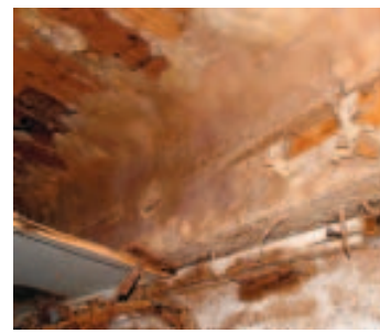
Vive l'hygiène! PHOTO PRÉTEXTE

> Denrées périmées et mérule: outre quelques manquements aux normes d'hygiène, des produits dont les dates étaient périmées ont été emmenés. Plus inquiétant: la présence de mérule a également été détectée dans