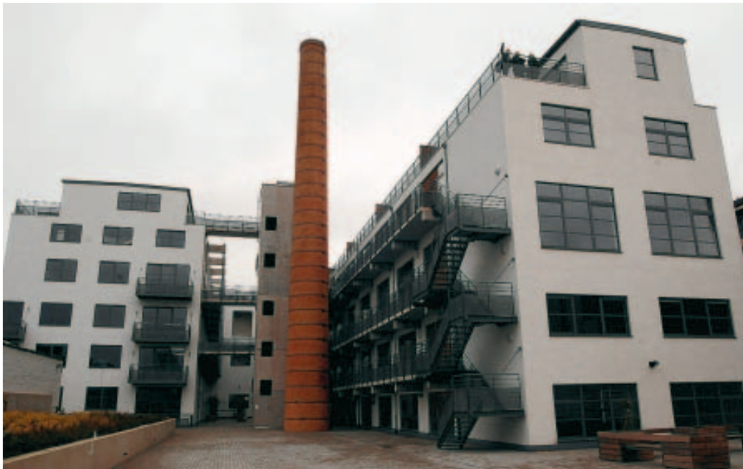
La cheminée est restée au milieu du village.