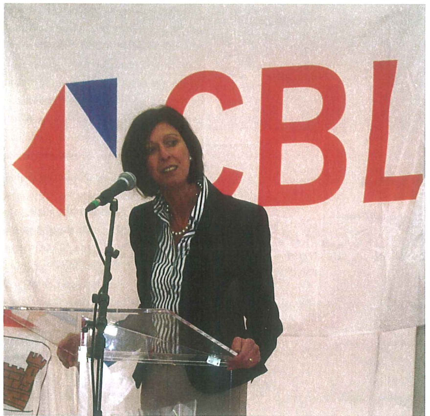
Lydia Mutsch, députée-maire d'Esch/Alzette

Ainsi, des toitures vertes ont été installées. Elles favoriseront l'absorption des poussières urbaines, la limitation des chocs thermiques, la régulation des pluies d'orages et l'isolation sonore. Elles permettront, en outre, d'ajouter de l'espace utile au bâtiment et contribueront à l'esthétique. Les façades seront crépies pour une meilleure isolation, des bardages en bois et verre constitueront les balcons et de grandes verrières agrémenteront le rez-de-chaussée.